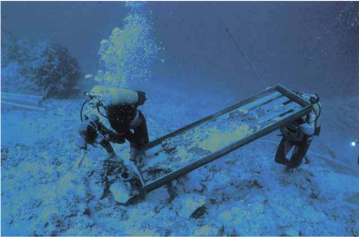
Figure 1: Lifting of ship timbers in purpose-built wooden trays. Uluburun Shipwreck, Turkey.