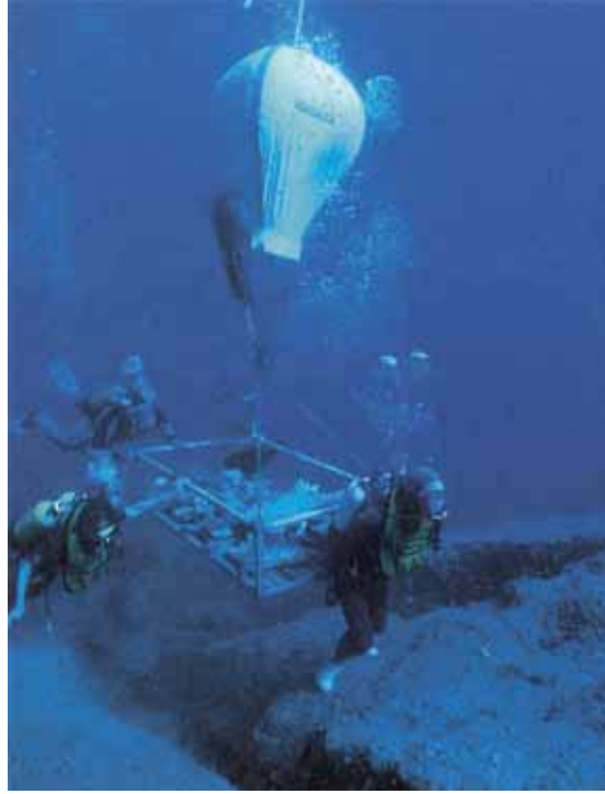
Figure 2: Lifting artifacts using an air filled lifting bag. Uluburun Wreck, Turkey. Resim 2: Hava ile doldurulmuş taşıyıcı balonla buluntuların taşınması. Uluburun Batığı, Türkiye.

To carry out desalination, the permanent lab must be provided with a large supply of pure water and a well-designed system for monitoring conductivity readings. Rain water, a good source of relatively pure water, can be collected as it drains from roofs into purpose-built tanks. Very pure water is produced by reverse-osmosis, distilla-