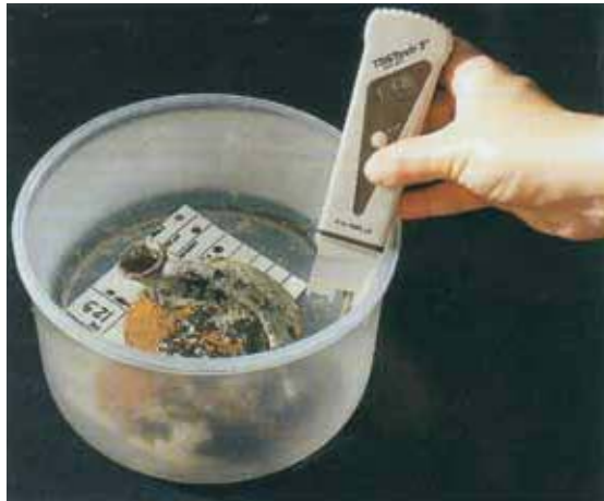
Figure 3: Measuring salt content of wash water with hand held conductivity meter. Resim 3: Tuzdan arındırma için kullanılan suyun tuz içeriğinin kondüktivite metre ile ölçümü.

Sualtıdan çıkarılan objelerin kalın bir kabuk halinde deniz tortusu ile kaplanmış oluşu ise konservasyonun sadece bu tür buluntulara has bir problemidir. Söz konusu kabuk tabakası deniz suyundaki tuzlar ve/veya