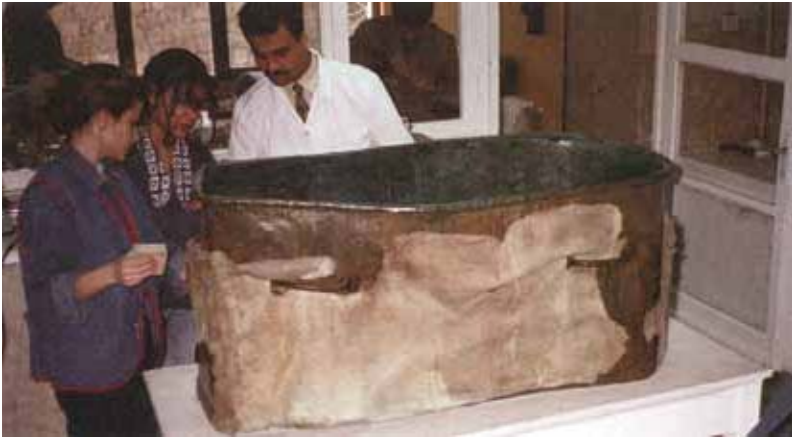
Figure 4: Leather wrapping on this bronze sarcophagus was preserved by copper alloy corrosion. Eastern Anatolia, purchased by the Museum of Anatolian Civilizations in 1997. Resim 4: Bronz lahit üzerindeki deri kılıf, bakır alaşım korozyon önleyicisi ile korunması. 1997 yılında Doğu Anadolu'daki, Anadolu Medeniyetleri Müzesi tarafından satın alınmıştır.

Pas lekelerinin çıkarılması, kir birikintileri veya büyük tekstillerde katların açılması gibi daha karmaşık işlemlerin ise tam teşekküllü bir konservasyon laboratuvarında gerçekleştirilmesi gerekir. Eğer tekstil tamamen parçalanmakta ise veya yerinden kaldırılamayacak kadar zayıf ve hassas durumda ise sağlamlaştırma yapılması kaçınılmazdır. Konsolidasyon genellikle geriye dönüşlülüğü bulunmayan bir işlem olduğundan, bir konservatör tarafından ve zorunlu kalındığında başvurulmalıdır. Selüloz