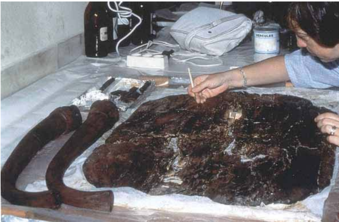
Figure 2: Cleaning fragments from Table 1, Tumulus MM, after consolidation. Gordion, Turkey. Credit: ©The Gordion Furniture Project / Gordion Mobilyaları Projesi Resim 2: Sağlama öncesinde Tümülüs MM'de bulunan 1 no'lu Masa parçalarının temizliği. Gordion, Türkiye. Fotoğraf: © The Gordion Furniture Project / Gordion Mobilyaları Projesi

Figure 3: Repairing fragments of the Child's Chair from Tumulus P. Gordion, Turkey. Credit: ©The Gordion Furniture Project / Gordion Mobilyaları Projesi Resim 3: P Tümülüs'ünde bulunan Çocuk İskemlesi'ne ait parçaların onarımı. Gordion, Türkiye. Fotoğraf: © The Gordion Furniture Project / Gordion Mobilyaları Projesi