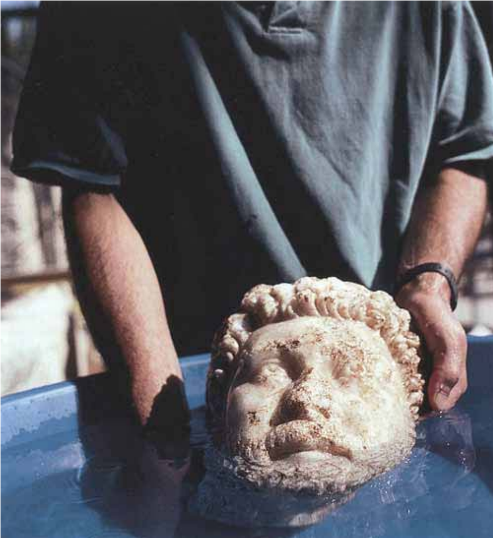
Figure 1: Washing stone head of Oikoumenios to remove loose soil deposits from burial. Aphrodisias, Turkey.