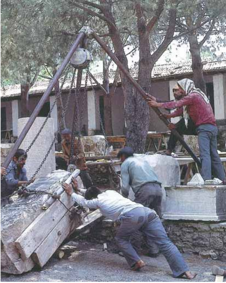
Figure 3: Lifting large stone stelae with chain hoist. Sardis, Turkey. Resim 3: Büyük taş stelenin zincirli kaldırıcı yardımıyla taşınması. Sardes, Türkiye.

If the artifact is to be exposed for a long time before lifting, keep it shaded and protect it with a plastic cover. Stone can be damaged by rapid changes in environment upon excavation. Shale, if found relatively wet, should be immediately placed in a sealed container and allowed to dry slowly since it is susceptible to delamination upon rapid drying.