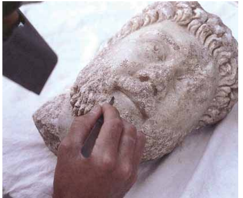
Figure 4: Careful mechanical cleaning of insoluble burial accretions from stone head of Oikoumenos. Aphrodisias, Turkey. Resim 4: Taştan yapılmış Oikonemos büstü üzerindeki suda çözülmeyen kabuk tabakasının mekanik olarak temizlenmesi.

Ağır objelerin taşınması sırasında vinç ve benzeri taşıyıcı iş makineleri kullanılmalıdır. Büyük taş objeler söz konusu olduğunda ise, depolama amacıyla kullanılacak rafların azami yük kapasitesine dikkat edilmelidir. Ağır objelerin doğrudan doğruya zemine yerleştirilmek yerine, zeminden yükseltilmiş tabanlar üzerinde depolanması ise hem ilerideki taşıma işlemlerini kolaylaştıracak, hem de objeleri su baskını riskinden koruyacaktır. Bunu sağ-