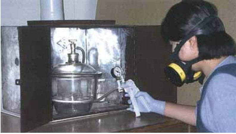
Figure 2: Treatment of bronze disease with benzotriazole under vacuum pressure, within safety chamber. Kaman-Kalehöyük, Turkey.

Resim 2: "Bronz hastalığı"nın benzotriazole çözeltisi ile vakum altında ve çeker ocak içinde muamelesi. Kaman-Kalehöyük, Türkiye.