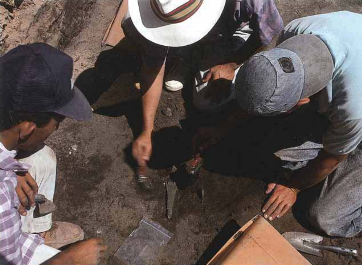
Figure 1: Careful excavation of copper alloy dagger. Kaman-Kalehöyük, Turkey.